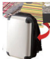
Kisekai arrange 着せ替えアレンジ構造