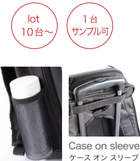
Drink holder ドリンクホルダー

アイデアを創意工夫で簡単にリュックサック作成可能です。着替も簡単。上部開閉設計されたハードタイプのボディは収納BOXのように荷物をきれいにたっぷり収納可能。パソコン・タブレットを入れる各ポケット付で抜群のユーザビリティを実現致します。