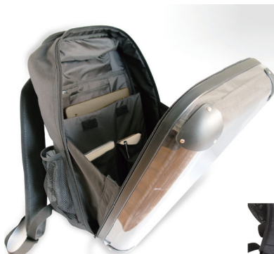
Frap type pocket フラップウレタンポケット付