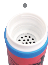
氷ストッパー付き