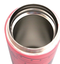
ステンレス真空二重構造

人気のグローバル都市と人気カラーが合わさったボトルシリーズ。お土産・贈り物にも。機能性も兼ね備えた真空性ボトル。